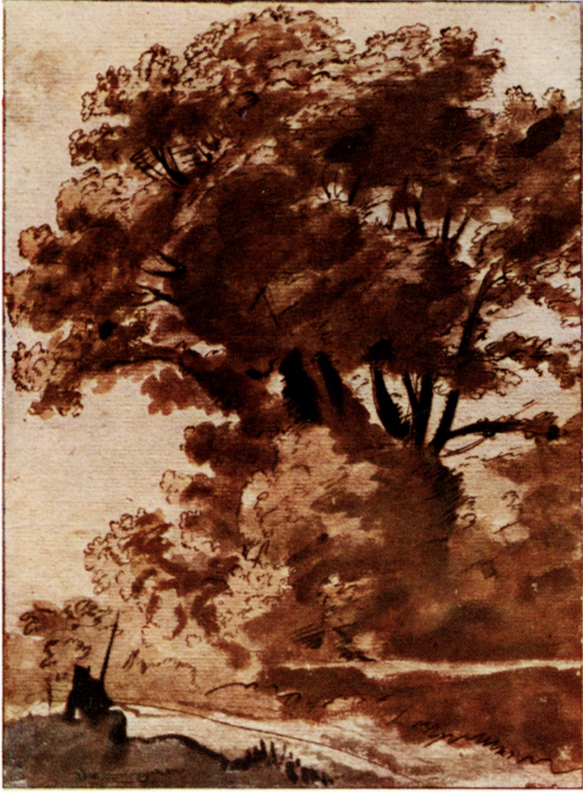
Claude Lorrain / Baumstudie. — Verkl. Wiedergabe nach dem Iris-Facsimiledruck