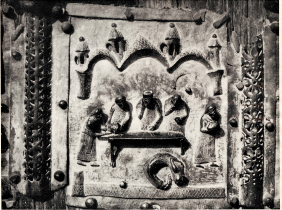
San Zeno de Vérone (Porte sculptée en bronze)