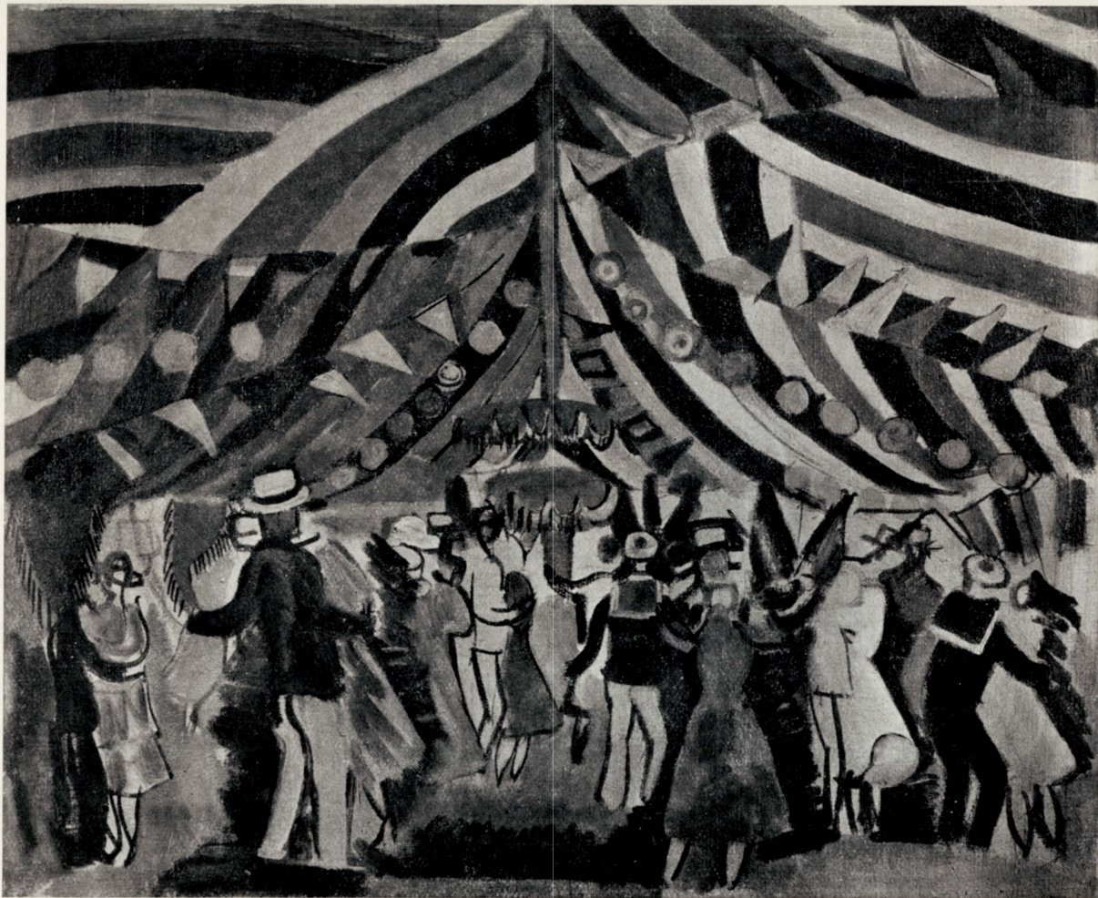
Dufy : Bal à Antibes.